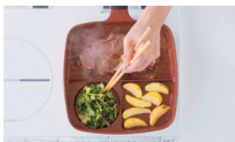
同時に3つの調理が可能です