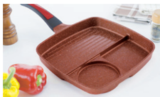
波型構造により、余分な脂を落とせます