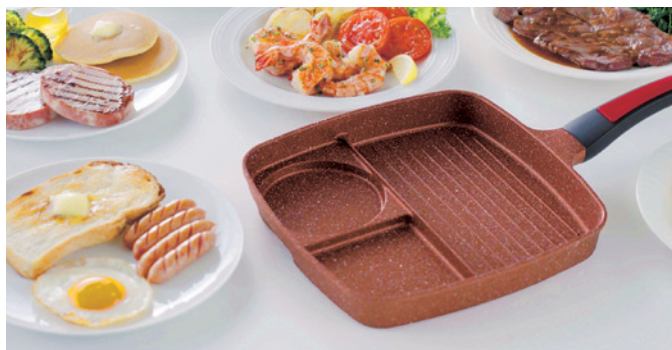
時短・お手入れのしやすさ、万能さを兼ね備えたフライパンです

内面はピンクダイヤモンドコート+マーブル加工でIH・ガス火を含むオール熱源対応。耐磨耗性試験100万回クリア。溝が深い仕切りなので料理が混ざる心配がなく同時に調理可能です。また、食パンを1枚そのまま焼けるワイド設計。丸型部を使えば目玉焼きを丸く焼くことも可能です。波型構造によりステーキや魚の余分な脂を落とし、料理をヘルシーに。