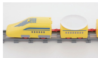
電車がお寿司をお届け