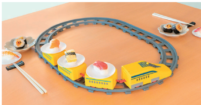
みんなで楽しくお寿司パーティー

電車がお寿司をお届け。手作りのお寿司やテイクアウトのお寿司をご自宅で回転寿司のように楽しめる「我が家の回転寿司トレイン」。いつもの食事に楽しみをプラスしてくれるアイテムです。お寿司以外にもスイーツやお菓子などの食材を乗せて楽しむことができ、誕生日のお祝いやクリスマス等特別な一日にも大活躍な商品です。ぜひおうち時間をお楽しみください。